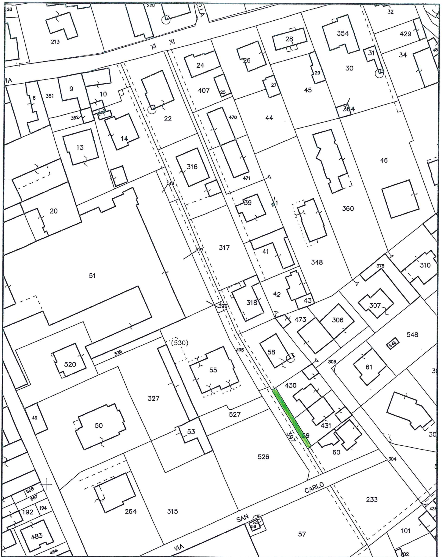
Comune di Sovico estratto mappa catastale 1:1000 foglio ...M... mapp. ...59.....