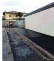
RIQUALIFICAZIONE AREA RESIDENZIALE