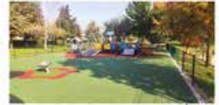
RIQUALIFICAZIONE AREA GIOCHI PARCO CASCINE