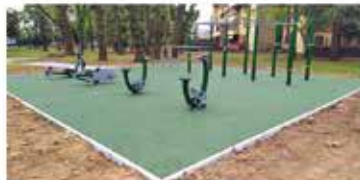
FORMAZIONE AREA LUDICO SPORTIVA