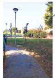
FORMAZIONE AREA SGAMBAMENTO CANI