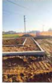
RIQUALIFICAZIONE AREA VERDE VIA MEUCCI/VIA DA VINCI