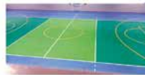
NUOVA PAVIMENTAZIONE AREA GIOCO