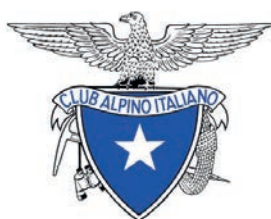
CAI-SEZIONE DI SOVICO APS-ETS

na a prezzi agevolati. Quest'anno sono stati attivati i seguenti corsi: ambiente innevato e canali; artva, pala e sonda; scialpinismo; falesia, arrampicata e multipitch; autosoccorso, soste, nodi e calate; cordata in conserva; vie ferrate.