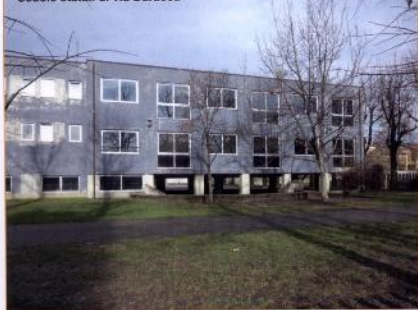
Scuole statali di via Baracca

La Fondazione Cariplo con l'intento di contribuire a superare questi ostacoli, ha emanato il bando "Audit energetico degli edifici di proprietà dei Comuni piccoli e medi" sostenendo progetti di dia-