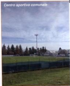
Centro sportivo comunale

Altro versante che dovremo affrontare, in una seconda fase, sarà quello che riguarda la scuola media alla quale, nell'ambito del rifacimento dell'intonaco previsto, si è deciso di applicare direttamente un "cappotto" coibente di cospicuo spessore al fine di migliorare le prestazioni dell'involucro dell'edificio. Tale intervento verrà effettuato nel 2011.